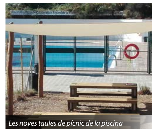
Les noves taules de pícnic de la piscina

Aquest estiu s'han col·locat taules de pícnic i tendals al costat de la piscina de La Floresta, creant un espai de descans i de trobada que ha estat molt freqüentat pels usuaris de la piscina. S'hi han invertit 10.000€.