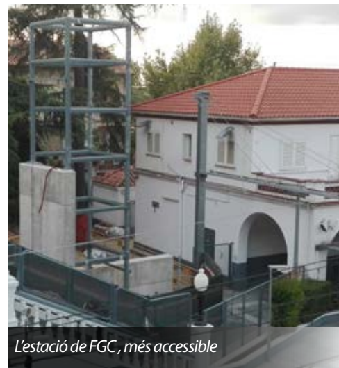
L'estació de FGC, més accessible

Potenciarà l'accessibilitat en aquest punt neuràlgic de la Floresta, salvant el desnivell que hi ha entre la plaça Josep Playà i l'estació (andana direcció Barcelona). Les obres van a càrrec de FGC i el manteniment el farà l'Ajuntament.