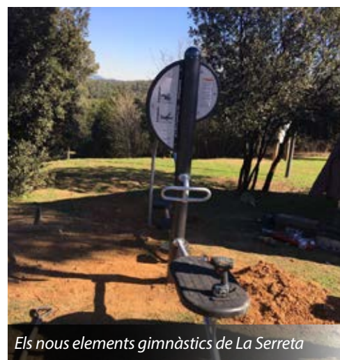
Els nous elements gimnàstics de La Serreta

Aquest nou circuit de salut està format per diversos elements a l'aire lliure, pensats per facilitar la pràctica esportiva i els hàbits saludables. Els aparells estan situats a poca distància d'entre ells, la qual cosa permet compartir amb altres veïns i veïnes la pràctica esportiva.