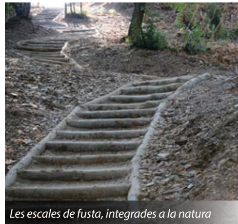
Les escales de fusta, integrades a la natura

Amb la voluntat de facilitar l'accessibilitat de veïns i veïnes, es renova l'escala que connecta el passatge Verdaguer amb el carrer Quadra de Canals. D'altra banda, recentment també s'han adequat escales de fusta -perfectament integrades en l'entorn natural- per millorar l'accessibilitat en llocs de pendent pronunciat. S'han instal·lat al Bosc Literari i entre la plaça Josep Playà i el carrer Bonavista.