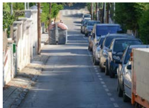
Farem un carrer més agradable per als vianants

Reurbanitzarem aquest carrer -que connecta diversos equipaments públics i forma part del camí escolar de la Floresta- per fer-lo més amable i accessible per als vianants. Adequarem un paviment únic i es col·locaran elements perquè els vehicles redueixin la velocitat. A més s'eliminarà l'aparcament -a excepció dels dos extrems- i es posarà mobiliari urbà per fer més agradable l'estada al carrer.