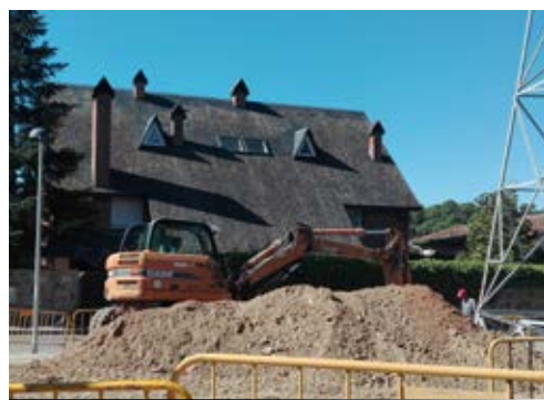
Millorem la plaça dels Estrets

En les properes setmanes també començaran les obres de pavimentació de la plaça Mas Fortuny: es col·locaran tanques de protecció, nou mobiliari urbà i s'arranjaran vials, vorals i murs.