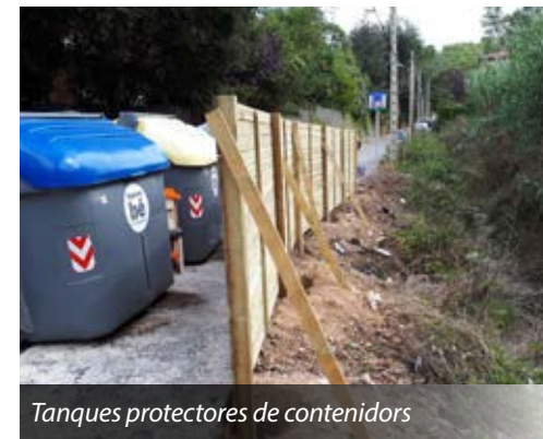
Tanques protectores de contenidors

S'han instal·lat, amb bons resultats, tanques al voltant de contenidors per evitar que els senglers puguin tombar-los i remenar-los.