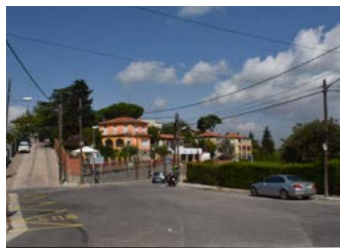
La plaça guanyarà espai per als vianants

Renovarem la plaça perquè els vianants disposin de més espai en detriment dels vehicles. Per això s'adequarà una zona amb paviment de sauló, es plantaran arbres, s'enjardinarà i es col·locarà una font i més mobiliari urbà. L'objectiu és, en definitiva, facilitar l'estada dels veïns i veïnes perquè aquesta plaça tingui un ús més ciutadà.