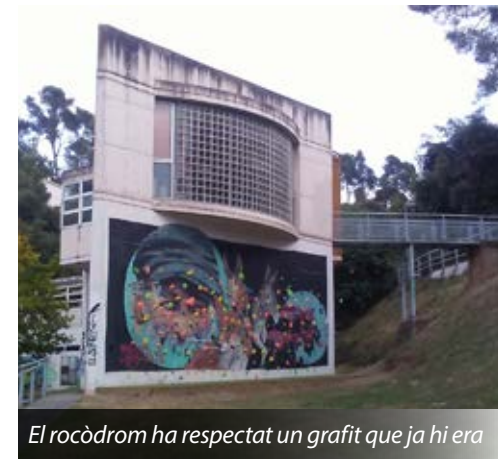
El rocòdrom ha respectat un grafit que ja hi era

Té nombrosos elements per escalar i un terra tou de seguretat de cautxú. A més, a les rampes de l'edifici s'ha posat material antilliscant per evitar caigudes.