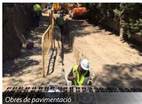
Obres de pavimentació

S'està completant la pavimentació del carrer Moret per tal d'eliminar la pols i el fang en el tram que actualment encara queda de terra.